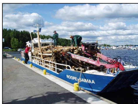
StoraEnson lahjoittamaa polttopuuta lastataan Roope-Saimaan kyytiin Imatran satamassa.